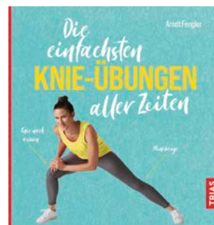
Abbildung: TRIAS Verlag

Arndt Fengler: Die einfachsten Knie-Übungen aller Zeiten. 120 Seiten. TRIAS Verlag. Broschiert. 19,99 Euro. ISBN: 978-3-432-11697-6. Auch als E-Book erhältlich.