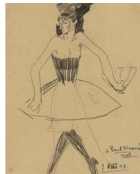
Amedeo Modigliani, Columbina im Ballettröckchen mit einem Fächer, 1908, Privatsammlung, Copyright © Privatsammlung