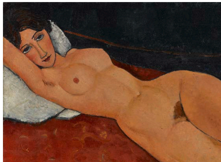
Amedeo Modigliani, Liegender Frauenakt mit weißem Kissen, ca. 1917, Staatsgalerie Stuttgart, Copyright © Staatsgalerie Stuttgart